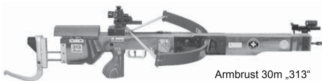
Armbrust 30m „313“