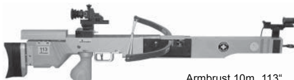
Armbrust 10m „113“