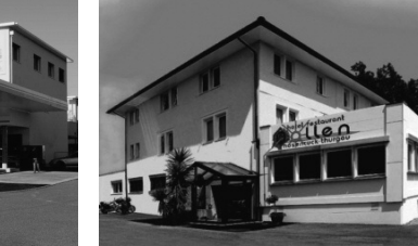
1 Hotel Schwanen